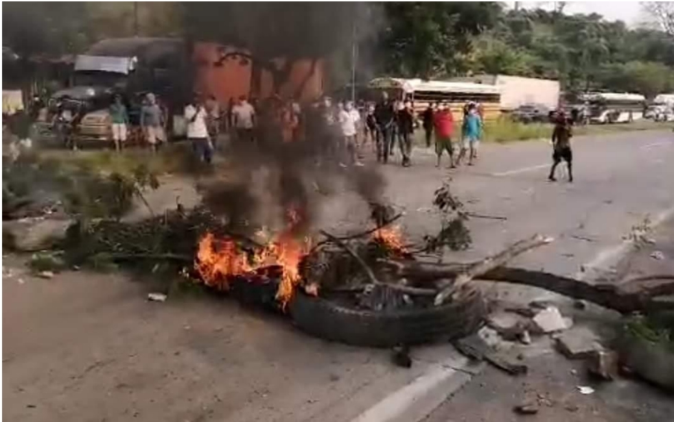
Protestas de pobladores en demanda de alimentos. Choloma, Cortés.

La situación del país se volvió confusa al momento del crecimiento de infectados a causa del coronavirus y se decidió emplear una alerta roja a nivel nacional y un toque de queda/Cuarentena para combatir la propagación del virus.