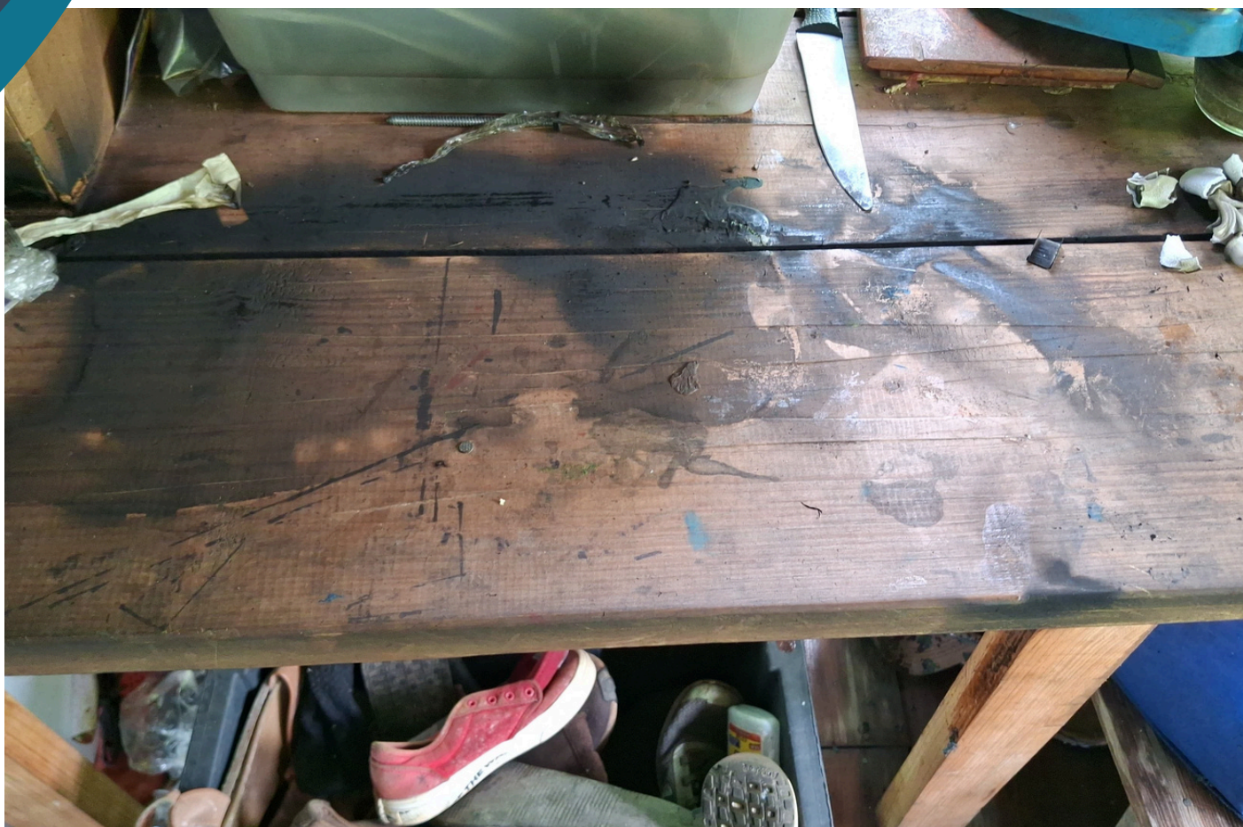
Fotografía: Casa de la periodista Yuam Pravia, tras el intento de incendio.